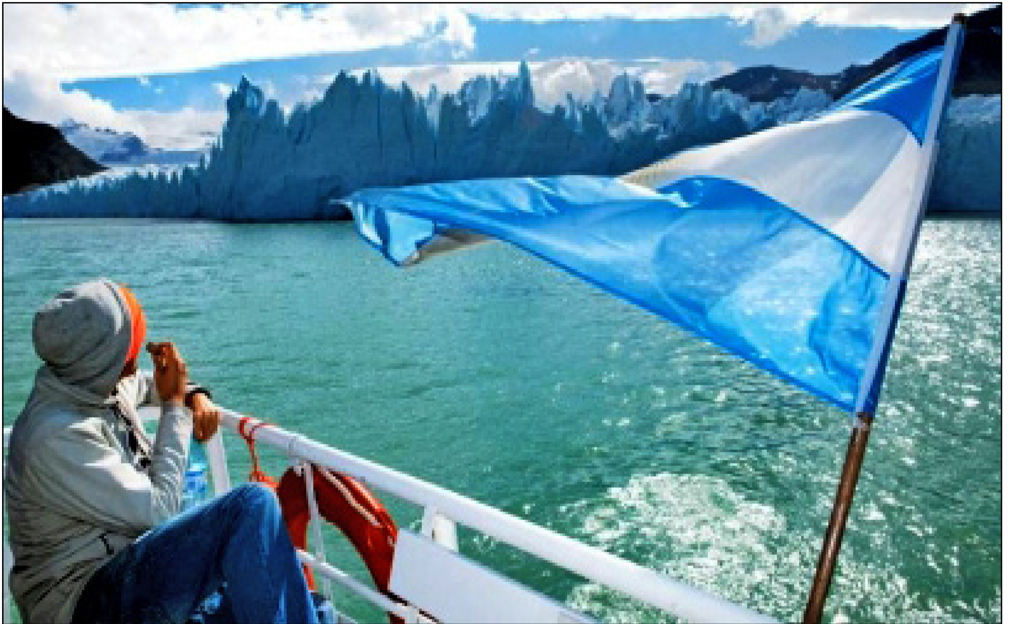
En turist njuter av utsikten över nationalparken Los Glaciares.

E fter rapporterna om klimatförändringarna har den internationella turismen till södra Argentina ökat med 400 procent.