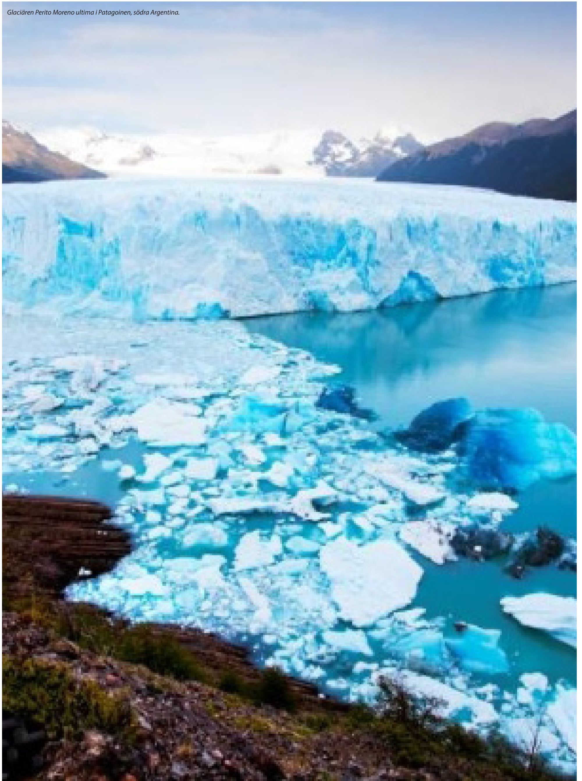
Glaciären Perito Moreno ultima i Patagoien, södra Argentina.